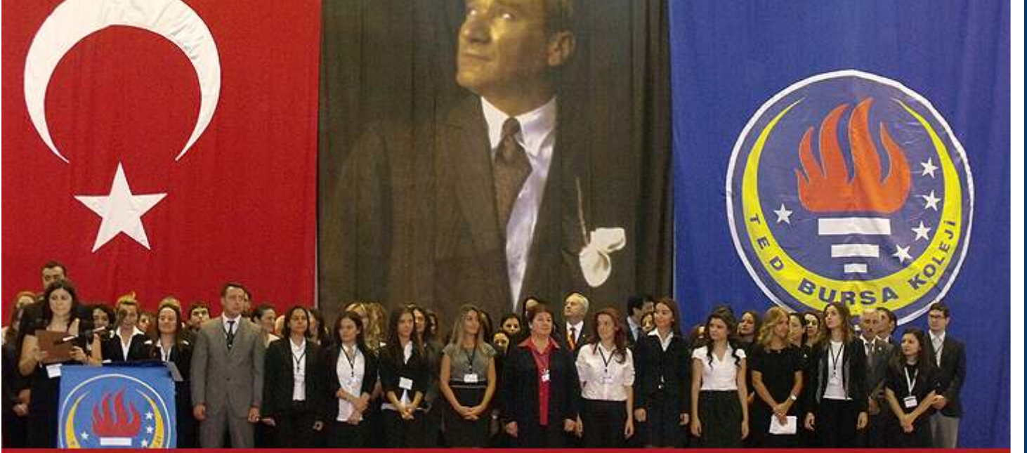
2011-2012 Eğitim Öğretim Yılı Açılışı